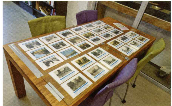
Foto-expositie tijdens de viering van het vijftienjarig bestaan van de Cultuurfabriek op 9 oktober 2025.

via www.oudveenendaal.nl al 1.400 foto's te bekijken, terwijl er inmiddels ruim 16.000 foto's in het systeem zijn ingevoerd. Daarnaast bevat de boekencatalogus 1.700 boeken, die allen zijn voorzien van een beknopte inhoudsbeschrijving. Ook dit jaar bezocht een aantal scholen het Documentatiecentrum in het kader van het samenwerkingsverband met School en Cultuur, het Gemeentearchief en Stadsmuseum Veenendaal voor het project over de Tweede Wereldoorlog.